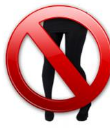
Pantalon legging ou collant