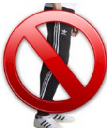
Pantalon de sport